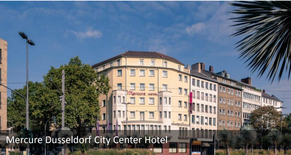
Mercure Dusseldorf City Center Hotel