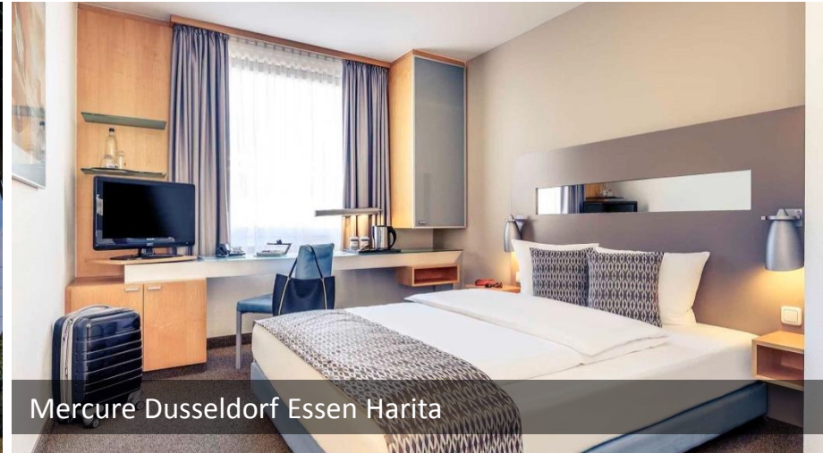
Mercure Dusseldorf Essen Harita

Konaklama, Dusseldorf şehir merkezinde bulunan Mercure Dusseldorf City Center Otel'inde yapılacaktır. Otel, fuarın gerçekleştirildiği Essen şehri ve fuar alanına 30 km mesafede yer almaktadır. Özel aracımız ile her gün fuar alanına transfer servisimiz bulunmaktadır. Konaklama tek kişilik odalarda kahvaltı dahil olarak gerçekleştirilecektir.